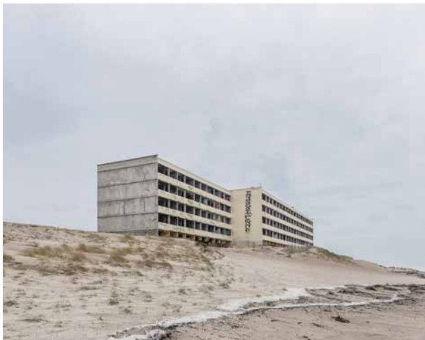
© Paul Baudon / le signal silencieux